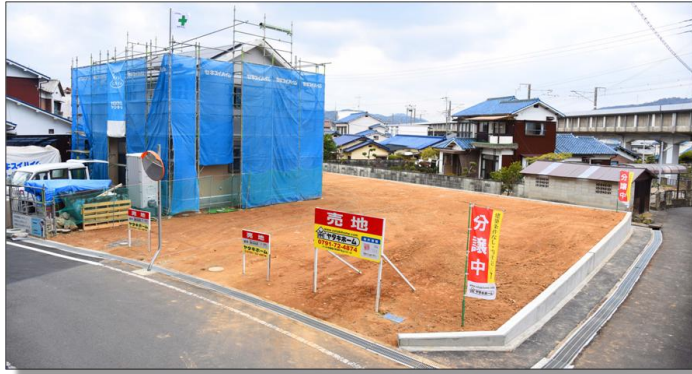
【面積及び販売価格】