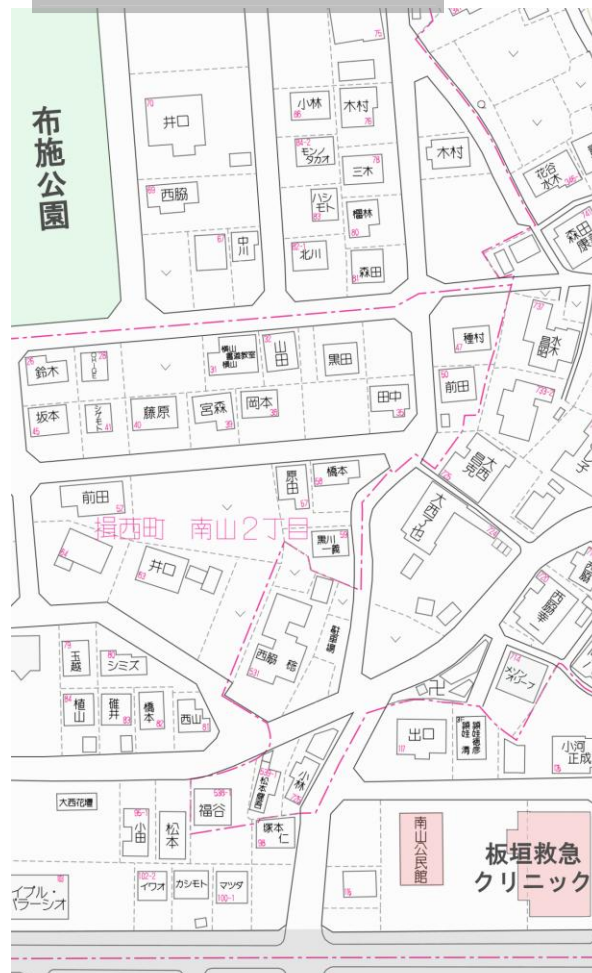
【面積及び販売価格】