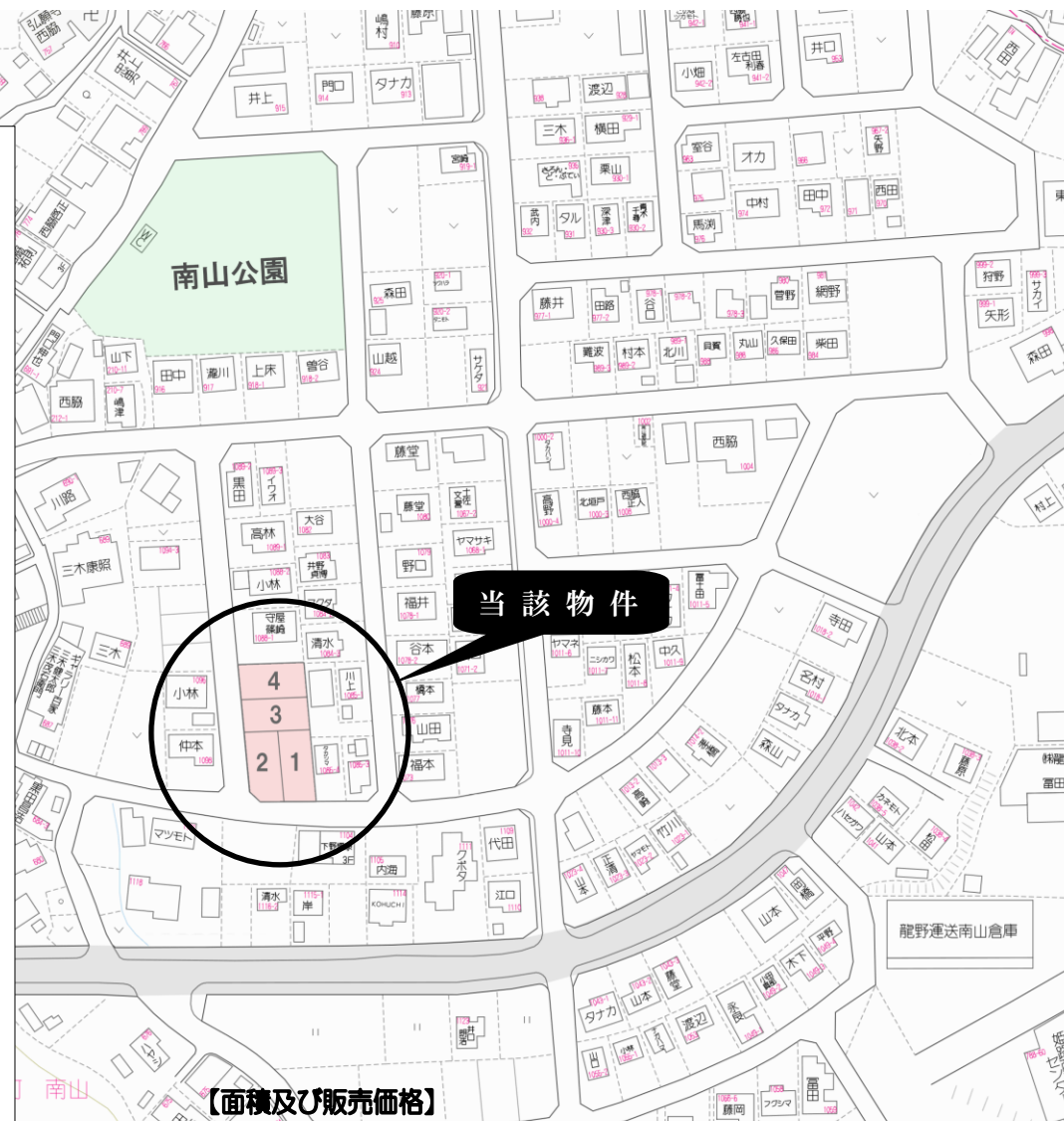
【面積及び販売価格】