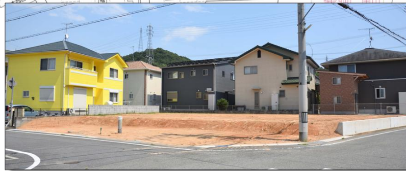
【面積及び販売価格】